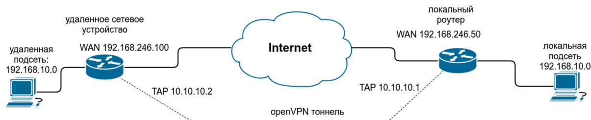
Рис. 3. Примеры конфигураций OpenVPN. Схема сети

В примерах настройки используется следующая схема сети: